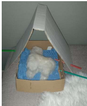
Figuur 4. Tent voor knuffel

Voor de kinderen die werden geplaatst in jeugdinstituten verloopt het transitieproces des te moeilijker. De veiligheid en geborgenheid die de (pleeg)families bieden, kan in de instituten niet worden gegarandeerd. Geregeld waren er discussies tussen de moeders en de instituten over een gebrek aan hygiëne en verzorging: ongekamde haren, ongewassen handen, ongeknipte nagels, ongewassen kleren en onbehandelde wonden. Bij drie van de acht kinderen die werden geplaatst in jeugdinstituten zijn er aanwijzingen en vaststellingen van seksueel grensoverschrijdend gedrag. In twee gevallen werd er klacht ingediend bij politie en parket. Hierop kwam geen respons. De confrontatie met het grensoverschrijdend gedrag haalde een van de moeders psychologisch onderuit, ook omdat ze de kans niet kreeg haar kinderen op dat moment op te vangen. Niet enkel omwille van de veiligheid is het belangrijk dat de kinderen terecht kunnen bij familie, maar ook omdat ze kunnen verblijven bij gekende en vertrouwde personen, die het best geplaatst zijn om de onthechting en ontworteling op te vangen en hun transitieproces naar een nieuwe, betrouwbare thuis te vergemakkelijken.