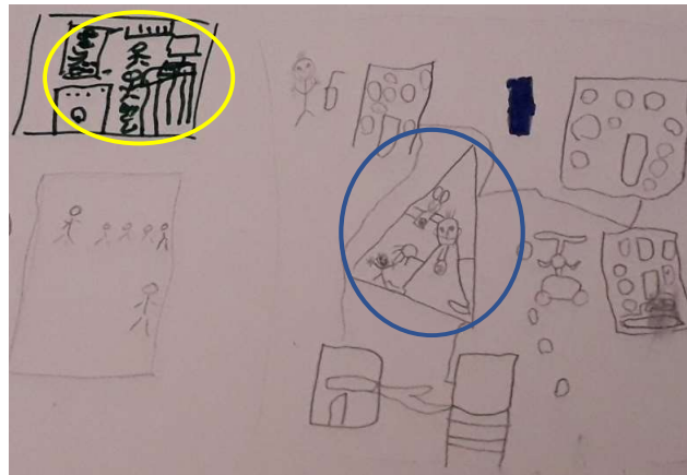
Figuur 3. Kindertekening detentiekamp (jongen, 5 jaar)

In het transitieproces van ontworteling naar zich opnieuw te kunnen thuisvoelen in een nieuwe vertrouwde omgeving spelen de moeders een belangrijke en betekenisvolle rol. De scheiding van moeders en kinderen bij aankomst in de luchthaven heeft op dit proces een zeer negatieve impact die riskeert te belemmeren dat de kinderen zich opnieuw zullen kunnen thuisvoelen. Voor verschillende kinderen is het gemis van hun moeder zodanig groot en pijnlijk dat ze het liefst zouden terugkeren naar de detentiekampen, zoals uitgedrukt in de volgende tekening van het detentiekamp: